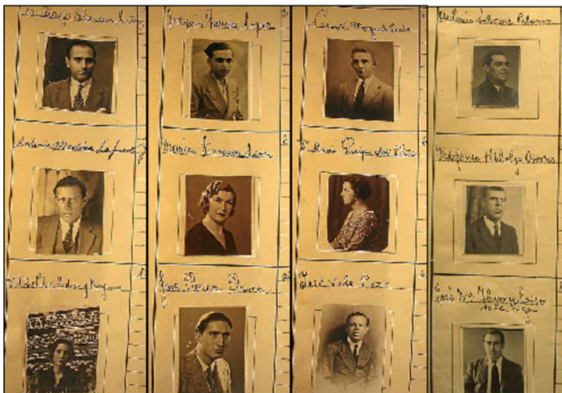
Conductores de Sevilla entre 1934 y 1939, en los álbumes de Tráfico.