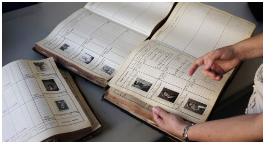
Libros con fotos y datos de conductores entre 1934 y 1939.

El país. Andalucía / Ángeles Lucas Sevilla 18 MAY 2014 - 19:25 CET