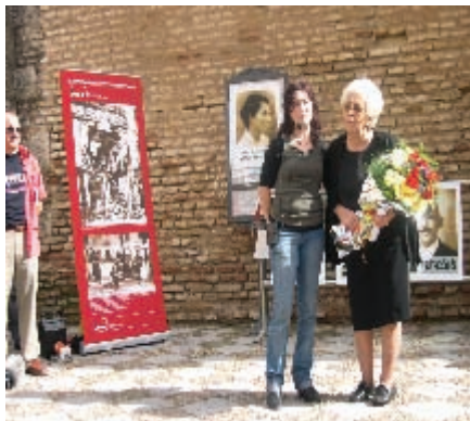
Homenaje a Antonia en la Sevilla Resistente.