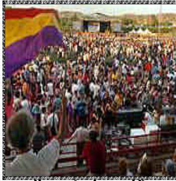
Homenaje a los republicanos

No habrá verdad ni conocimiento verdadero si no se tiene en cuenta esa parte de la realidad que no aparece porque ha sido declarada insignificante(..) No hay conocimiento de la realidad en su integridad sin la presencia de esa parte dolorosa que es el secreto de la memoria.