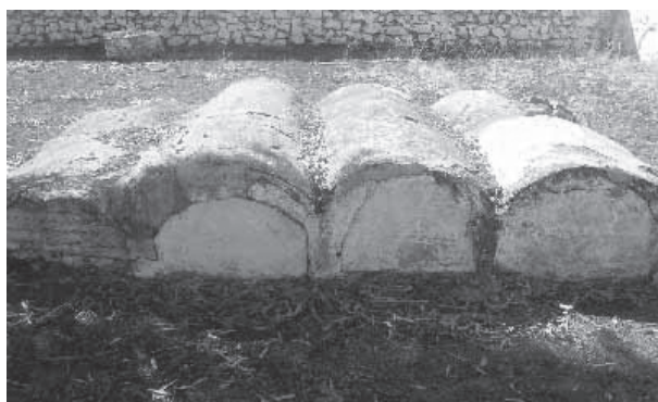
Fig. 5: Nichos Construidos con ladrillo y cemento a nivel del suelo

Otro grupo importante de enterramientos son los nueve nichos situados junto al monumento central construidos en cemento y ladrillo (Fig. 5). Se encuentran distribuidos en tres subconjuntos de 2, 3 y 4 nichos respectivamente.