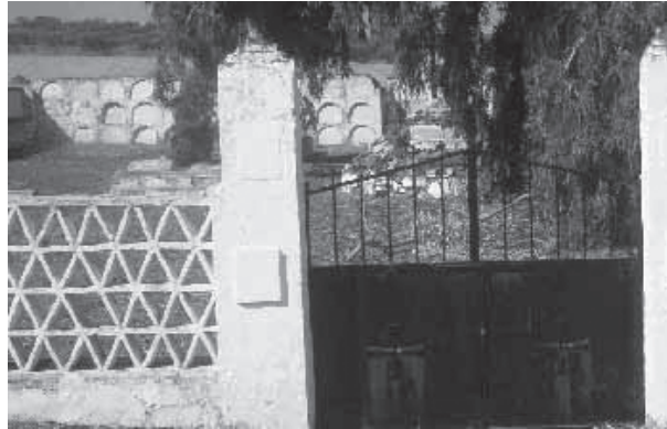
Fig. 1: Fachada Principal del Cementerio Italiano

mente conocida como carretera Castuera-Venta del Culebrín. En su realización se emplearon, como en tantas otras edificaciones de la época, piedras, con las que se elaboraron los cimientos y que, aproximadamente, llegan hasta la mitad del muro, y el resto fue levantado de tapial, excepto el muro de la entrada, que presenta una estructura de ladrillos colocados de forma romboidal enmarcados por pilares que dotan de mayor consistencia a la fachada, con un afán claramente decorativo (Fig.1).