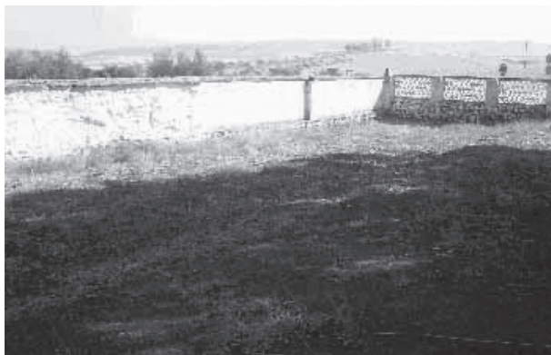
Fig. 6: Zona donde se ubicaría la posible fosa común

restos una vez concluida la contienda 14 . Esta fosa habría quedado separada por un pequeño muro del resto de tumbas que se encuentran situadas a ras del suelo. La ubicación de mencionada fosa se refleja en la (fig. 6):