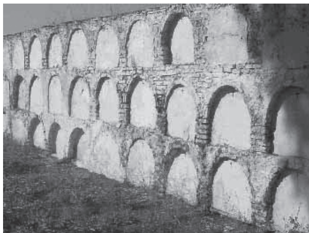
Figura IV: Grupo de nichos construidos con posterioridad a 1937

Otro grupo importante de enterramientos son los nueve nichos situados junto al monumento central construidos en cemento y ladrillo (Fig. 5). Se encuentran distribuidos en tres subconjuntos de 2, 3 y 4 nichos respectivamente.